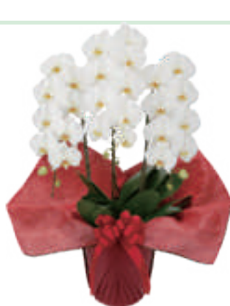
胡蝶蘭 3 本立