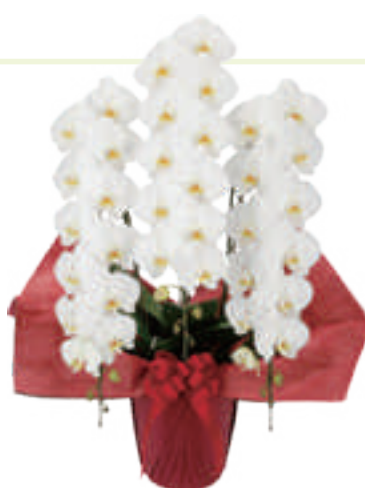
胡蝶蘭 3 本立