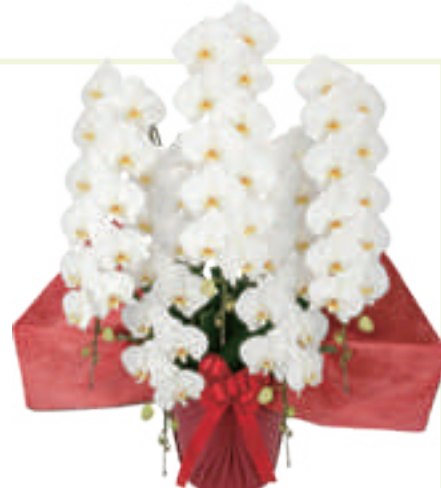
胡蝶蘭 5 本立