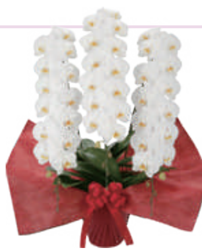
胡蝶蘭 3 本立