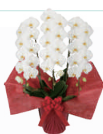
胡蝶蘭 3 本立