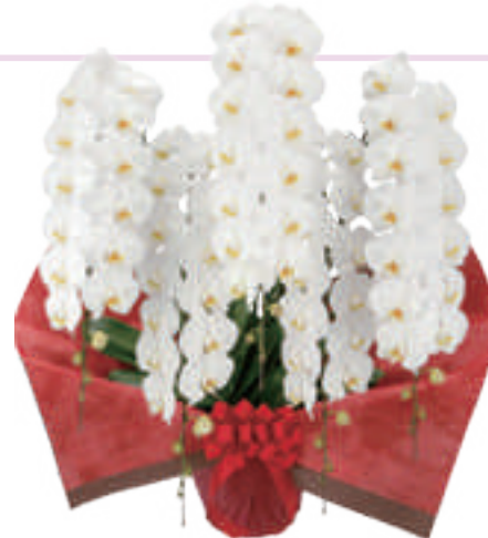
胡蝶蘭 5 本立