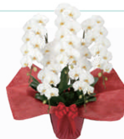
胡蝶蘭 5 本立