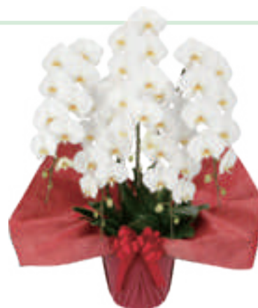
胡蝶蘭 5 本立